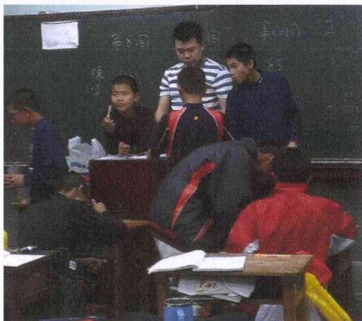
說明：討論數學題目