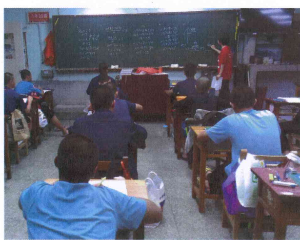
說明：八 B 數學課