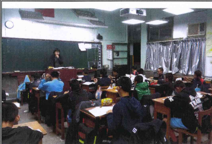
說明：七 B 國文課