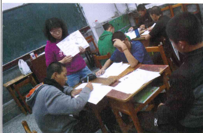
說明：九 B 國文課