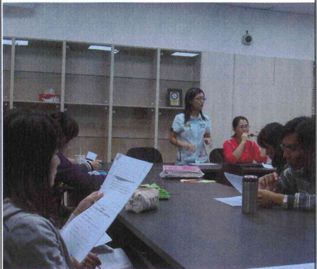
說明：補救教學輔導會議