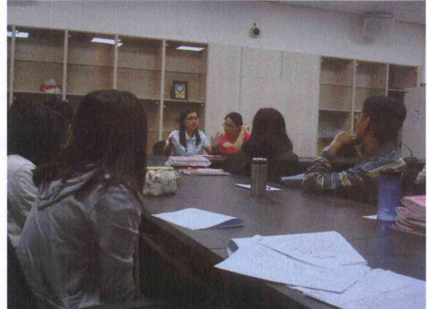
說明：討論開班情形